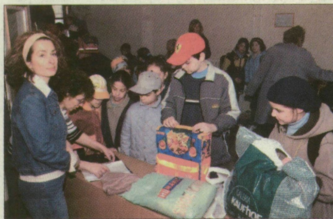
A diákok folyamatosan hozták a kinőtt ruháikat