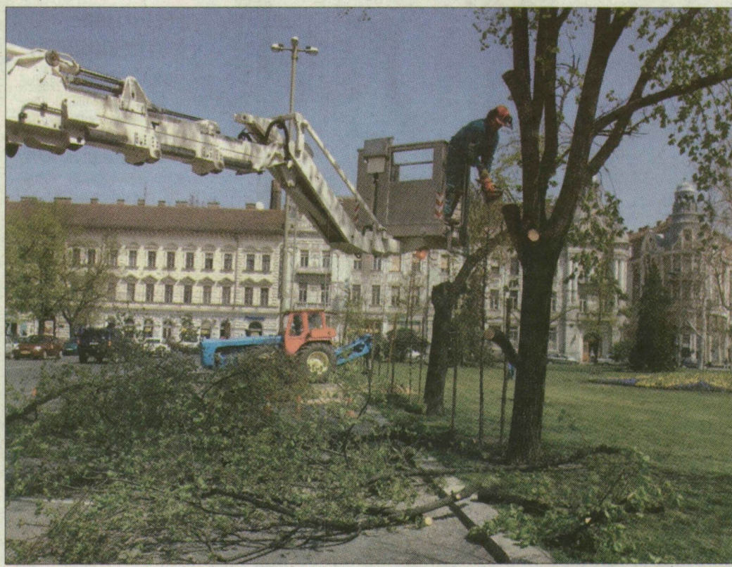
Fát vágna és ültetnek. Május közepére befejezik a parkfölvívítást

Három parktükörben – a Korzó mozival szemben, a Deák Ferenc-szobor, valamint a szökőkút körül – automata öntözőrendszert építenek ki: az esőérzékelővel ellátott locsolók újabb 9 ezer négyzetméteren permetezik majd éltető vízzel a növényeket.