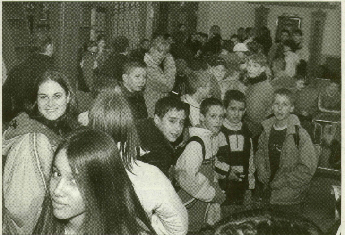
Gyülekeznek a gyerekek a Korzó előcsarnokában