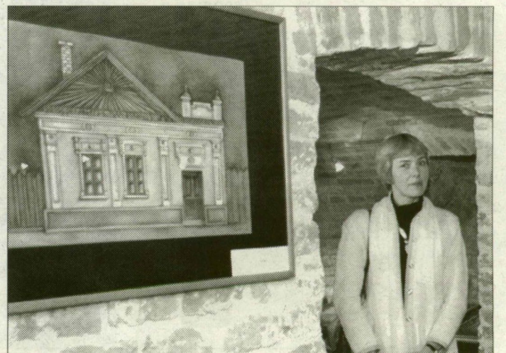
A múltat és a jelent őrzik Karsai Ildikó grafikái