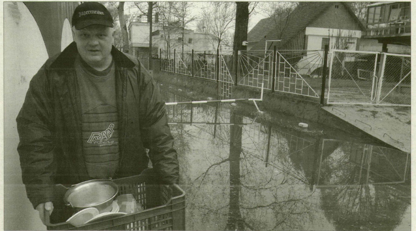
A szegedi Sárga üdülőterületről költözik a Kiskőrössi Halászcsernye is, nyakukon az árhullám