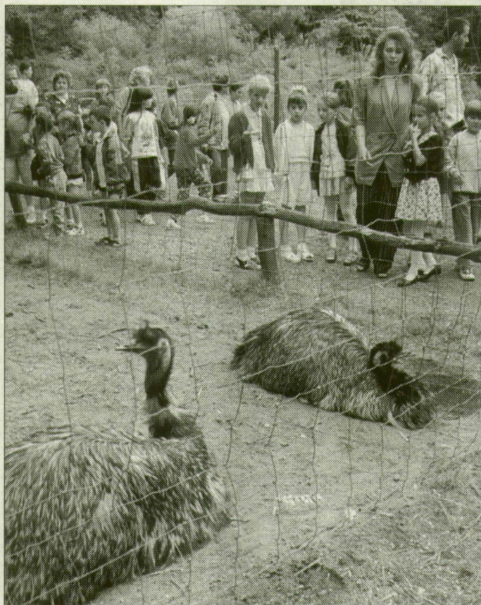
A leghálásabb látogatók a gyerekek

A legutóbbi közgyűlésen a képviselők 100 millió forintot szavaztak meg a vadaspark hároméves fejlesztési koncepciójára. Az idén összesen 35 millió 750 ezer forint támogatást kap a park a várostól. A Dél-Amerika-ház kialakítására 5 millió 750 ezret ad-