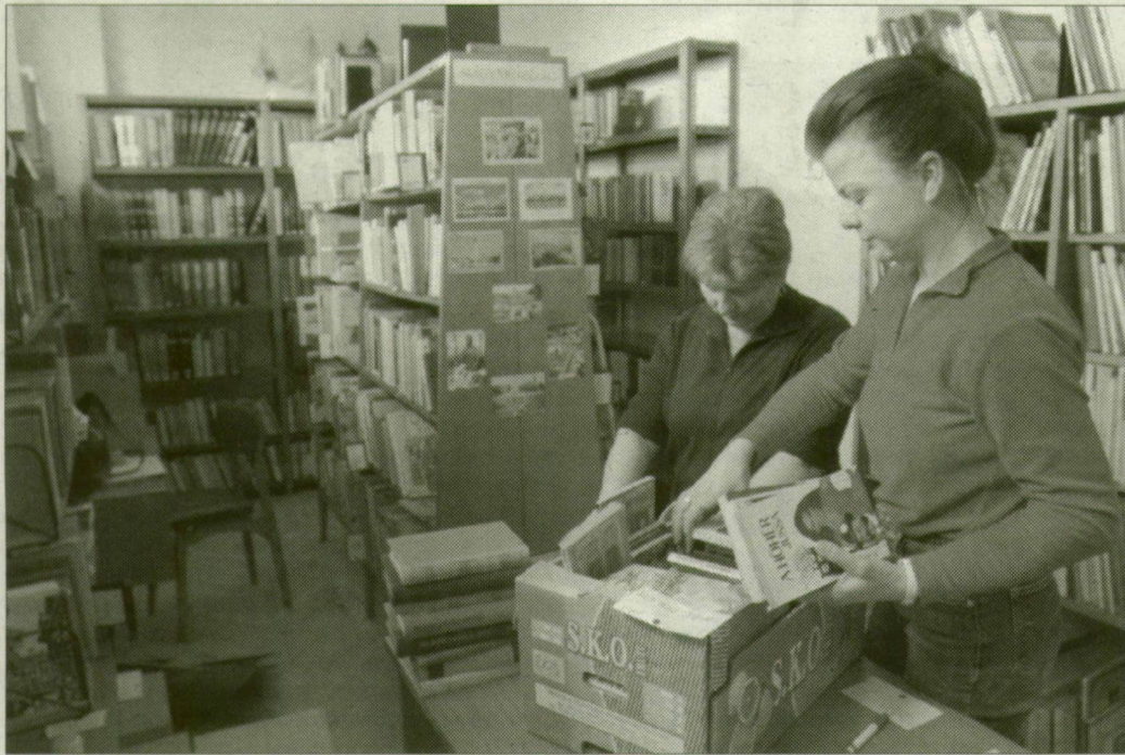
A kis könyvtárak is az olvasási kedvet szolgálták