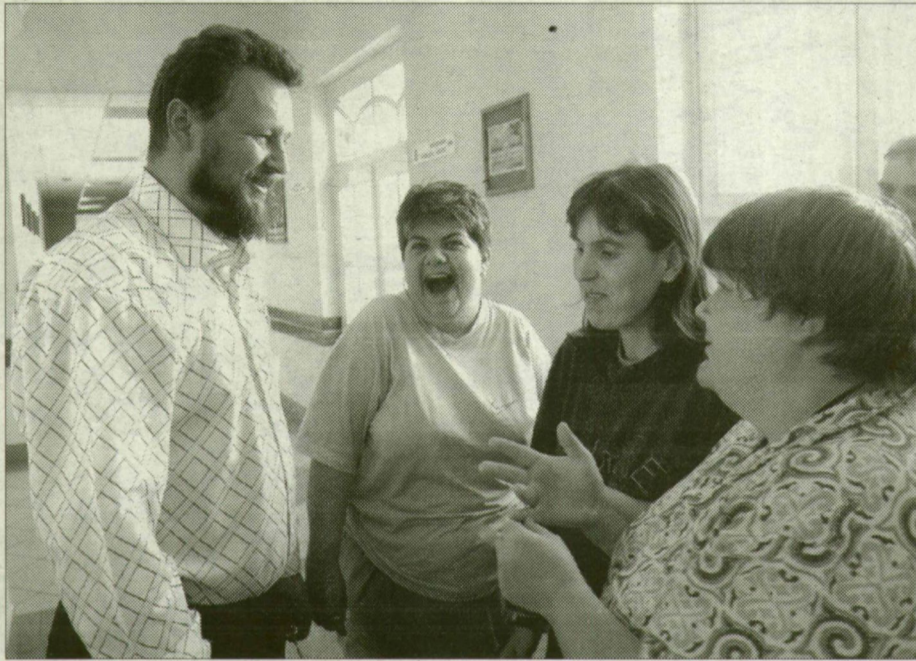
Az igazgató már nem sokáig marad az otthonban

A képviselő hozzátette: teljes körű vizsgálatot kezdenek, átnézik az intézmény összes dokumentumát, és a szakmai munkát is gör-