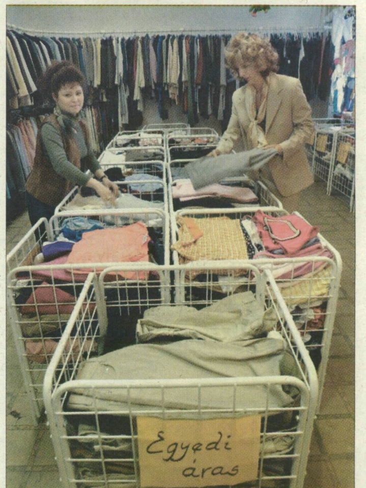
A turkálás nem csupán kényszer, olykor hobbi is.