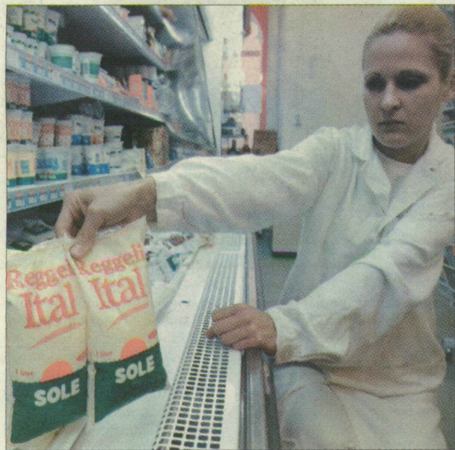
A zacskós reggeli ital a legolcsóbb