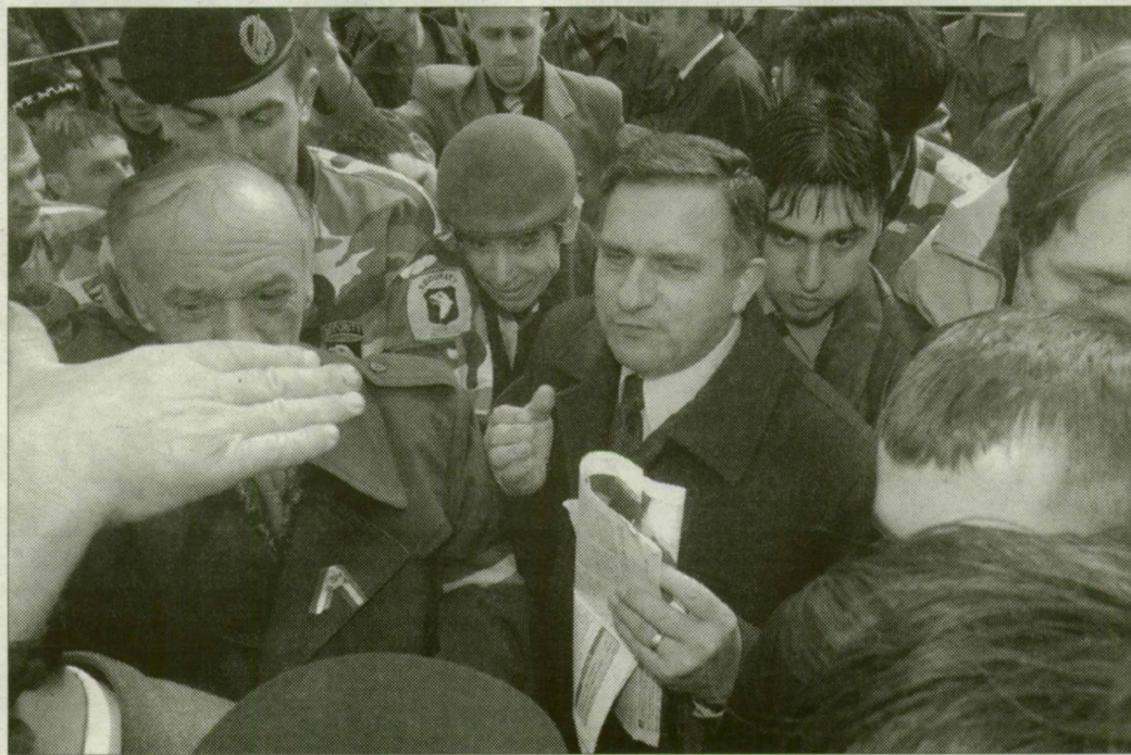
Tüntetést szervezett a Nagy Románia Párt Aradon, az Avran Iancu téren, ahol az aradi vértanúk emléktűzét megőrkítő Szabadság-szobor eredetileg állt. Az egykori talapzaton ma II. világháborús emlékmű, a román katona szobra található. A rendezvényen, amelyen mintegy ezer fő vett részt, Gheorghe Funar pártelnök (középen) mondott beszédet.