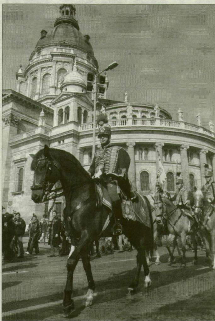
A nemzeti lovas díszegység is felvonult az 1848–49-es forradalom évfordulóján

A határon túli magyarokhoz intézett ünnepi üzenetet a kormányfő. Ebben Medgyessy Péter