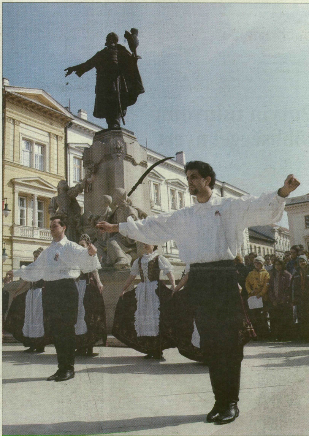
Napfény, tánc, ünnepi sokaság a Kossuth-szobornál

Az országos eseményekről a 2., a szegediekéről az 5. oldalon számolunk be