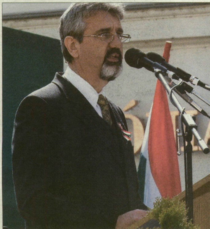
Szegeden Szabó Gábor, az egyetem rektora mondott ünnepi beszédet

Az egész ország március 15-ét ünnepelte tegnap, a hosszú tél utáni első, kifejezetten tavaszi napon. A legtöbb szónok az európai értékeket említette meg beszédében, az 1848-49-es forradalomra és szabadságharcra emlékezve.