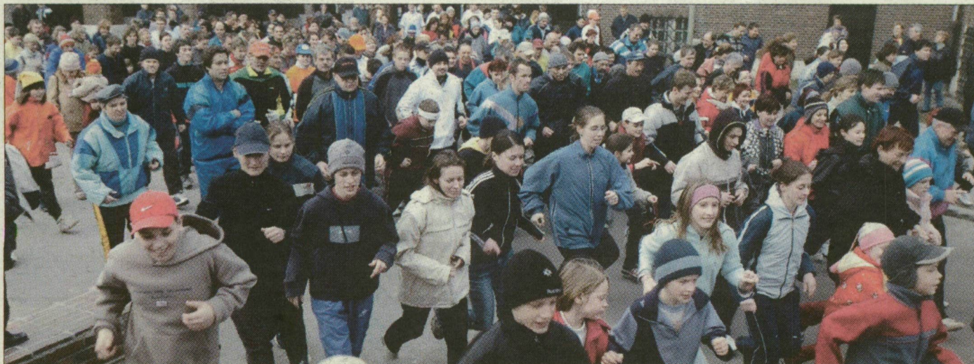
A szegediek sportosan, futva is emlékeztek a nagy tiszai árvíz áldozataira, hőseire