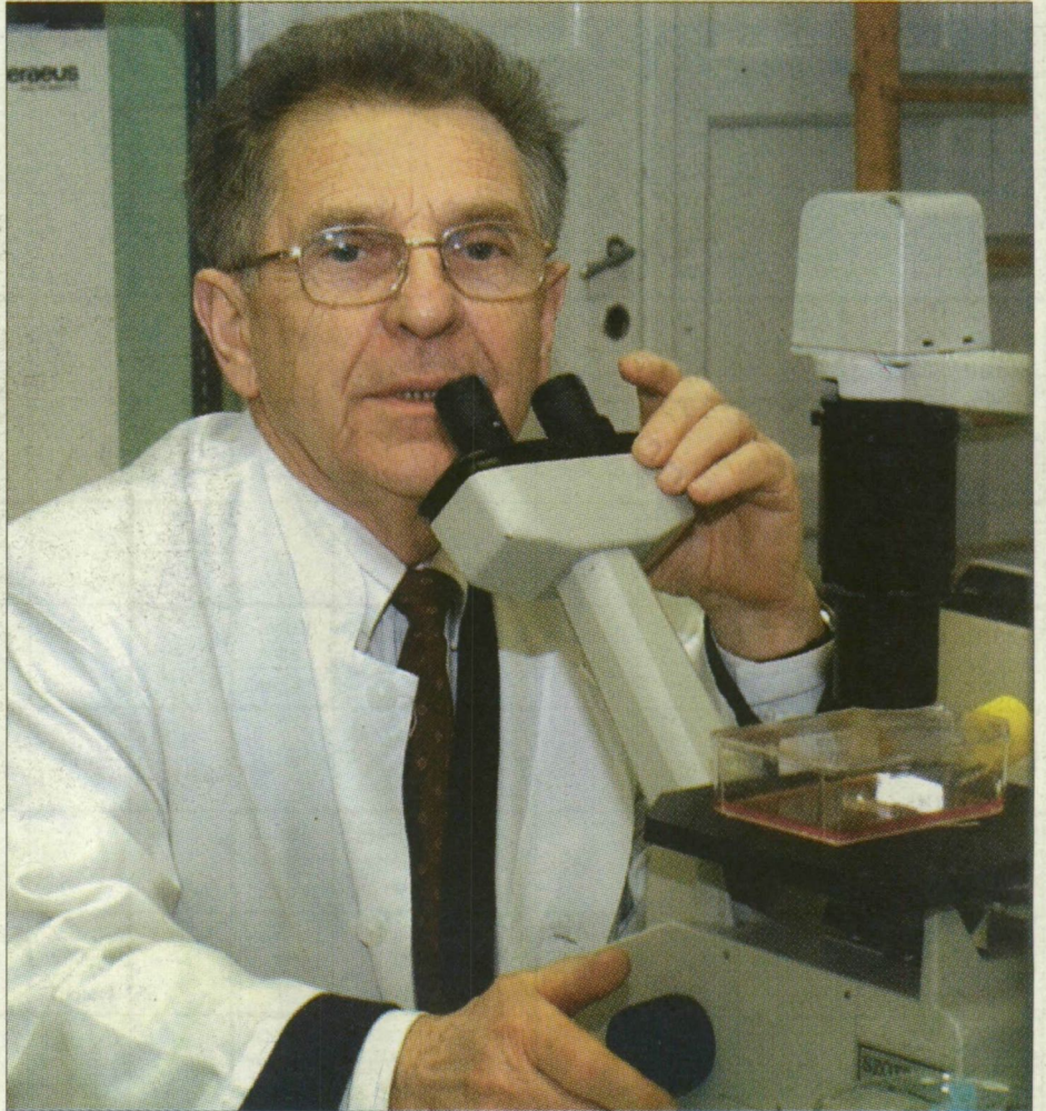
Molnár József: A tüdőrák tekintetében a kétes értékű első helyet foglaljuk el a világ országainak listáján