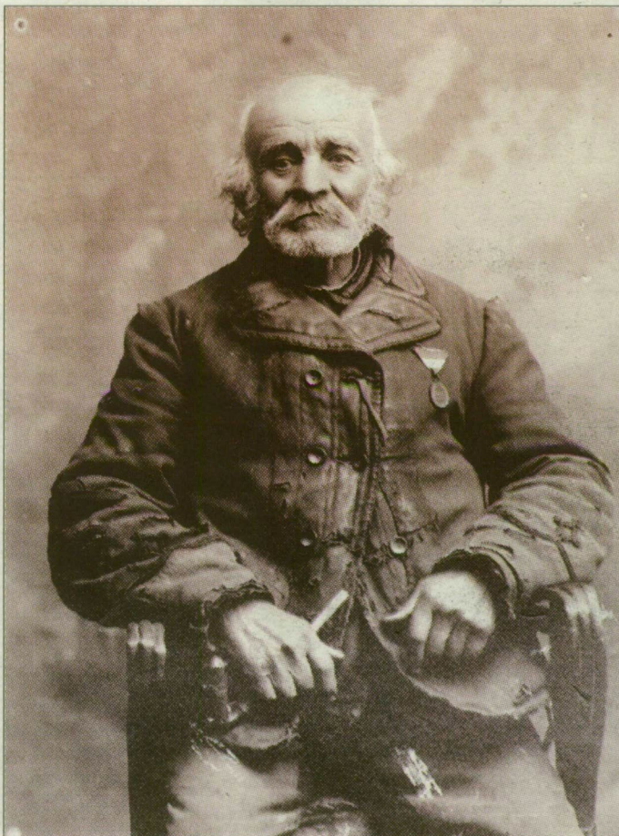
Három a megmaradt 154 Plohn-fotóból