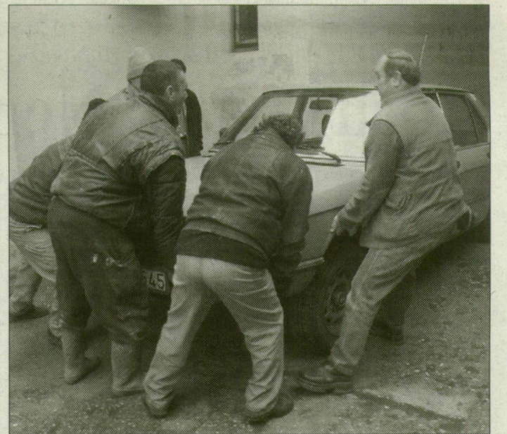
A kaput eltorlaszoló, lezárt BMW-t úgy kellett eltolni.

Nyolc ország 27 fiatal muzsikusa méri össze tehetségét