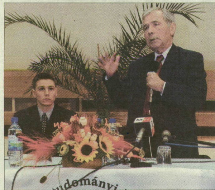
„Hiába zseniális a Lajos, ha nem állunk mögötte”

fórumának szervezői: az exkormányfő szó szerint zsúfolásig megtöltötte az MTESZ-székház nagytermét.