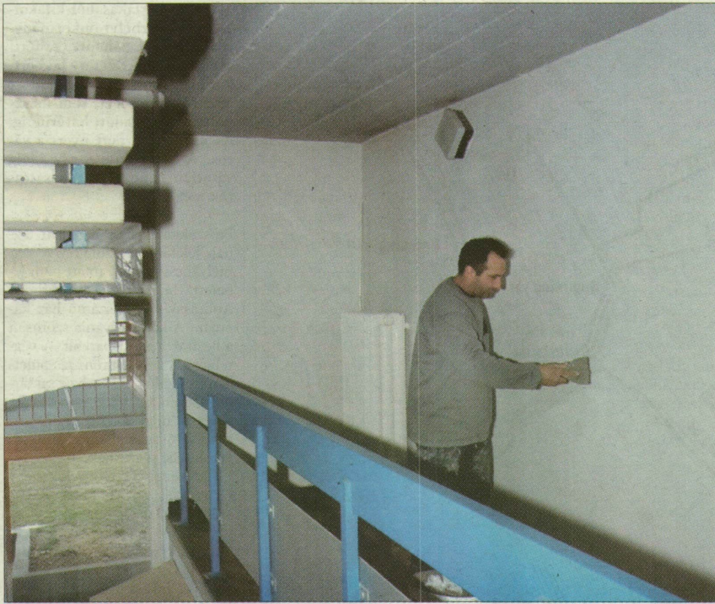
Utolsó simítások a sportcsarnokon belül