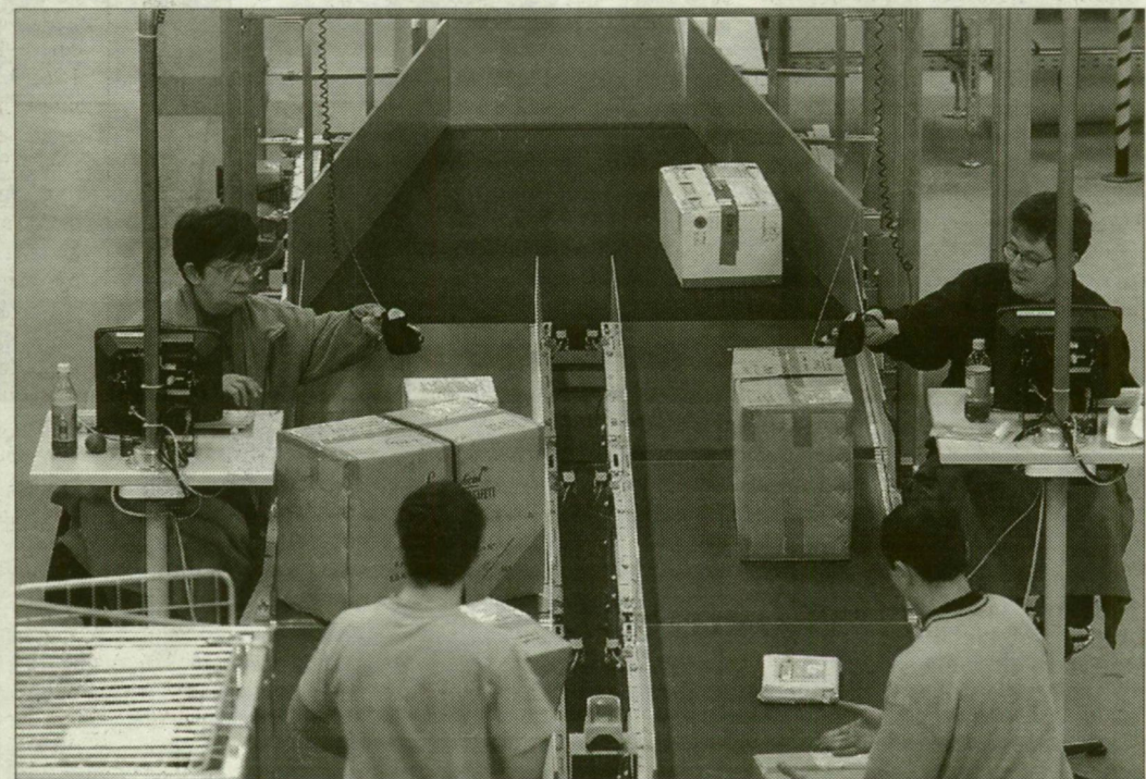
Javul a helyzet a posta budaörsi központjában, ahonnan az elmúlt napok fennakadásai miatt több százezer küldemény nem jutott el a címzettekhez