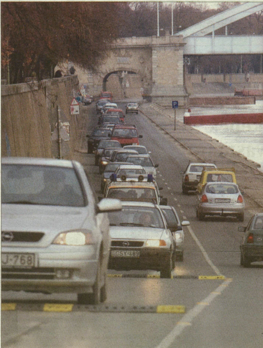
Tegnap a Belvárosi hídig ért a kocsisor a reggeli csúcsforgalom idején.