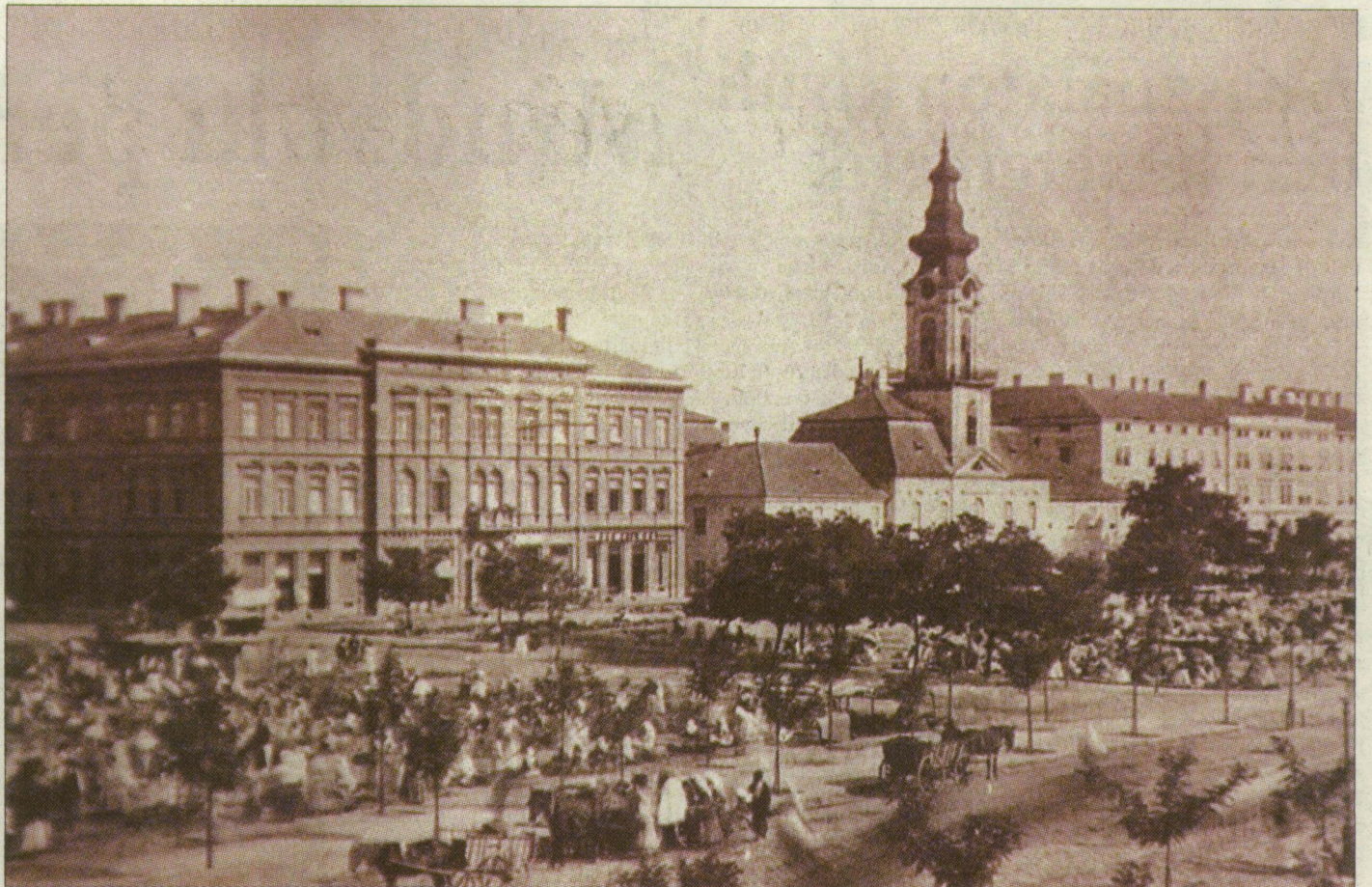
A Széchenyi tér a víz előtt. Bérház, városháza, Zsótér-ház. Adnak, vesznek, beszélgetnek

Szeged történelme rendszeresen tobzódik a legendás eseményekben. Nyilván a Tisza rejti Attila, a nagy hun király arany, ezüst és bronz állagú koporsóját. Bár Móra szerint a hunok túlzottan nem lakták be ezt a vidéket. Nem messze a Ferenccs testvérek mai klastromától, az alsóvárosi föld rejti Dózsa György nagy, busa fejét. Itt reszelgette körmeit aktuális szanzont dúdolgatva a jó Szapolyai 1526 augusztusában, midőn a magyar politikai elit színe javát beleölték a mohácsi határmező sáros földjébe, plusz királygyilkolásra igénybe vétetett a felzaklatott Csele-patak is. A monda szerint az alsóvárosi Havi Boldogasszony-templom építéséhez igazságos Mátyás adta, szponzori minőségben, a királyi felöltőjét. A szexuálisan túlfűtött Hóbiárt basát Szegeden ütogettek agyon papucsokkal a szegedi nők, akik mesés, különböző történelmi korokon átívelő szépsége azóta is kedvezően árnyalja a város elbírálását. Póri- asabban: Szegeden található a legtöbb, egy négyzetméterre eső szép nő a világon. Szeged arra is tanúság, hogy polgármesterei nincsenek biztonságban. Az még hagyján, hogy a bamba nép fel nem fogja nagy ívű elképzelésüket, jóakaratu-