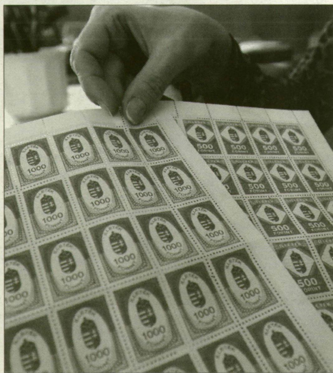
A postán minden mennyiségben hozzájuthatunk az illetékbélyeghez