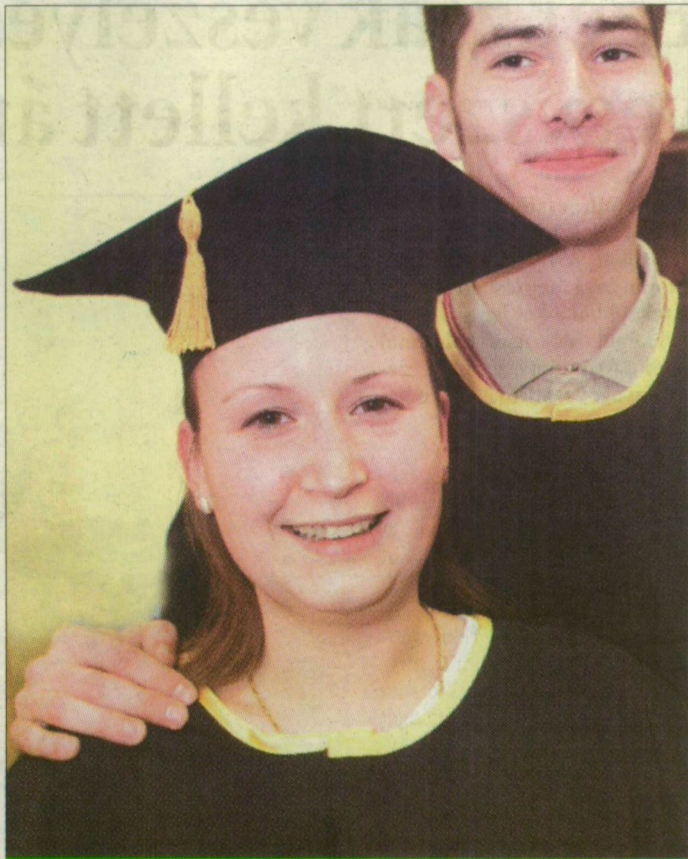
A júniusi diplomaosztó ünnepségen már ezt a viseletet öltik magukra a végzősök