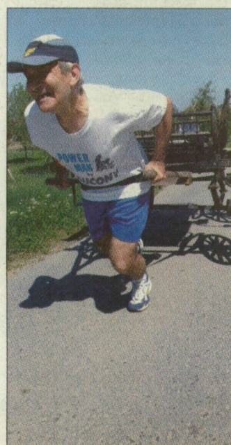
Halad a szekér, ha erősen húzzák

– Ha sikerül teljesítenem ezt a 320 kilométeres távot, harmadik alapekordomat állítom fel. De nem csak az lelkesít, hogy így bekerülhetek a rekordok könyvébe. Az április 21. és május 1. közötti időszakra tervezett futással két dologra is szeretném felhívni a figyelmet. Egyrészt a „Drog nélkül, tisztán” Tisza-parti képviselőjének. Tavaly májusban felállította a 24 órás kocsihúzás világrekordját is, kerek 100 kilométert körözve