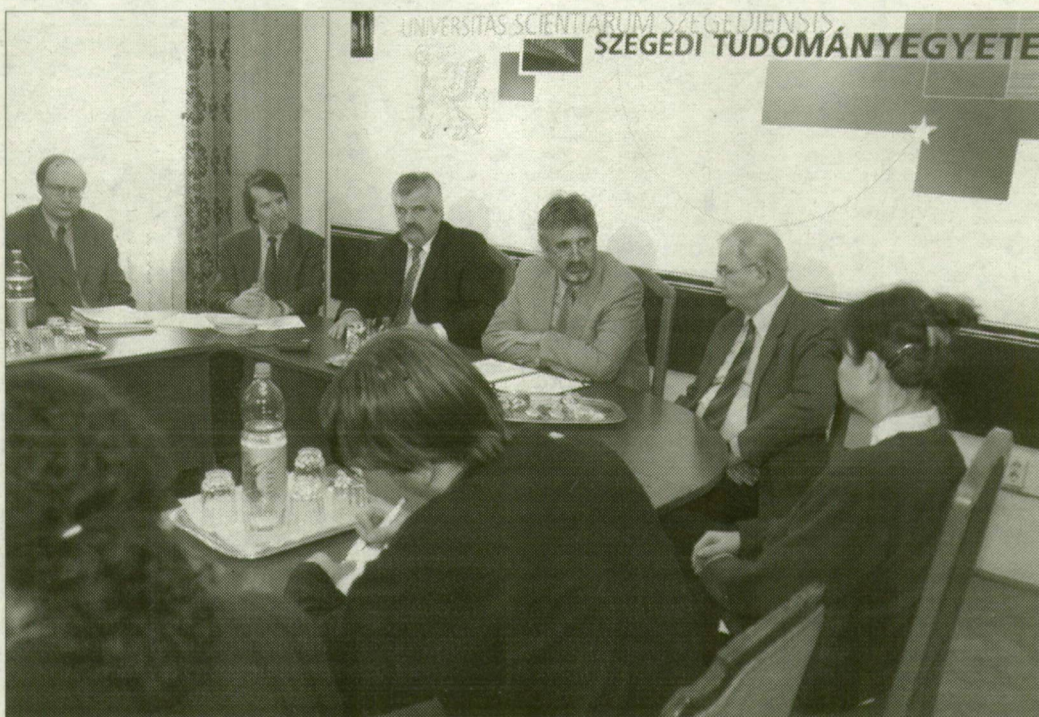
A szegedi egyetem tanácsa a tegnapi fórumon