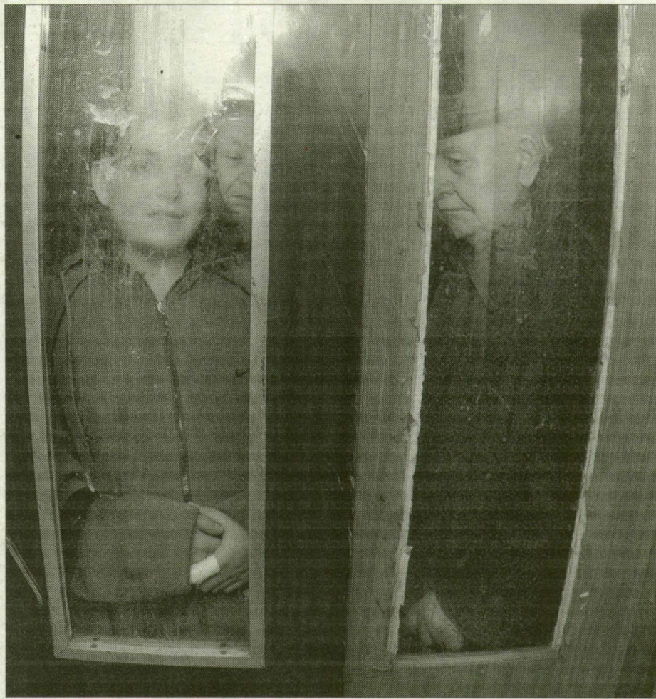
Ha leáll a lift, az öregek, a mozgássérültek lakásuk rabjaivá válnak

A Retek utca 7.-hez hasonló állapotban van a szegedi lakótelepi fölvonóknak körül-