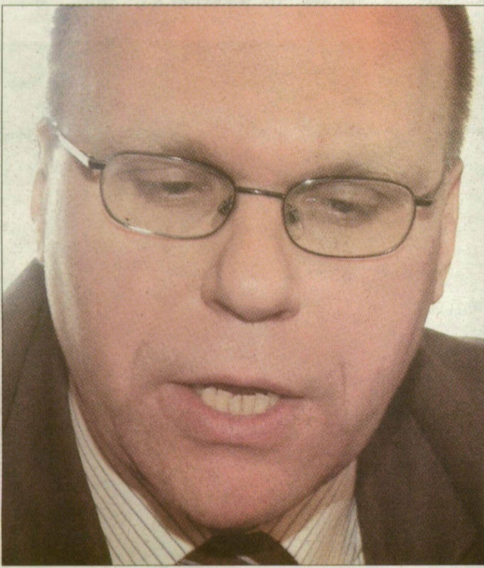
Rafal Wisniewski nagykövet szerint a beruházók az egyetemi városokat kedvelik

– Mielőtt ide eljöttem, beszéltem a vajdaság és Lódz város vezetőivel. Szegedi látogatásom meggyőzött akkori gondolatom helyességéről: sok hasznos tapasztalatsere, sokféle kétoldalú együttműködés lehetőségét látom, s a két megye közötti kapcsolatok mellett hasznos lenne a