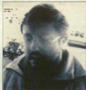
A képen látható férfi illetékesenül jutott 340 ezer forintra

Az ismeretlen tettes még aznap 340 ezer forintot vett fel Szentesen, az egyik Kossuth utcai automatából. A tranzakció közben azonban a pénzkidő kamerája felvétel készített róla. A Szentesi Rendőrkapitányság kéri azokat, aki felismerik a férfit, vagy az ügyvel kapcsolatban bármilyen értékelhető információval tudják segíteni a nyomozást, hogy hívják a 06 63/312-433-as vagy a 06/80/555-111-es számot.