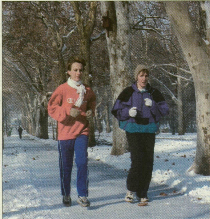
Az életminőség egyik meghatározója a rendszeres mozgás