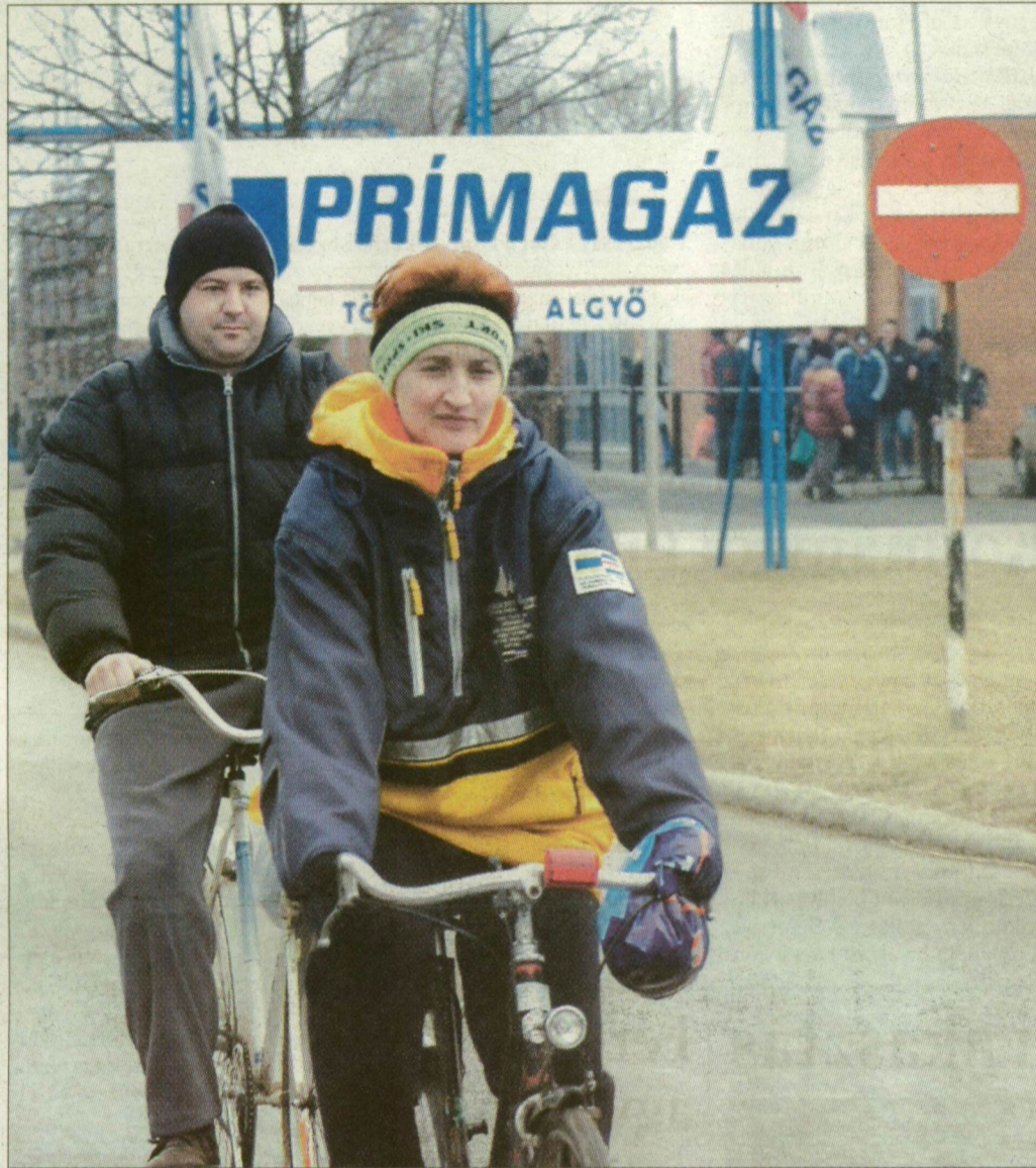
Jövő hónapban már kevesebben hajtanak a Prímagáz-telepről hazafelé