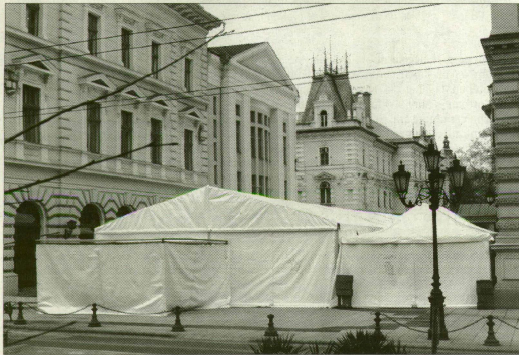
Szokatlan látvány a Stefániától csaknem a Széchenyi térig érő fehér lepel