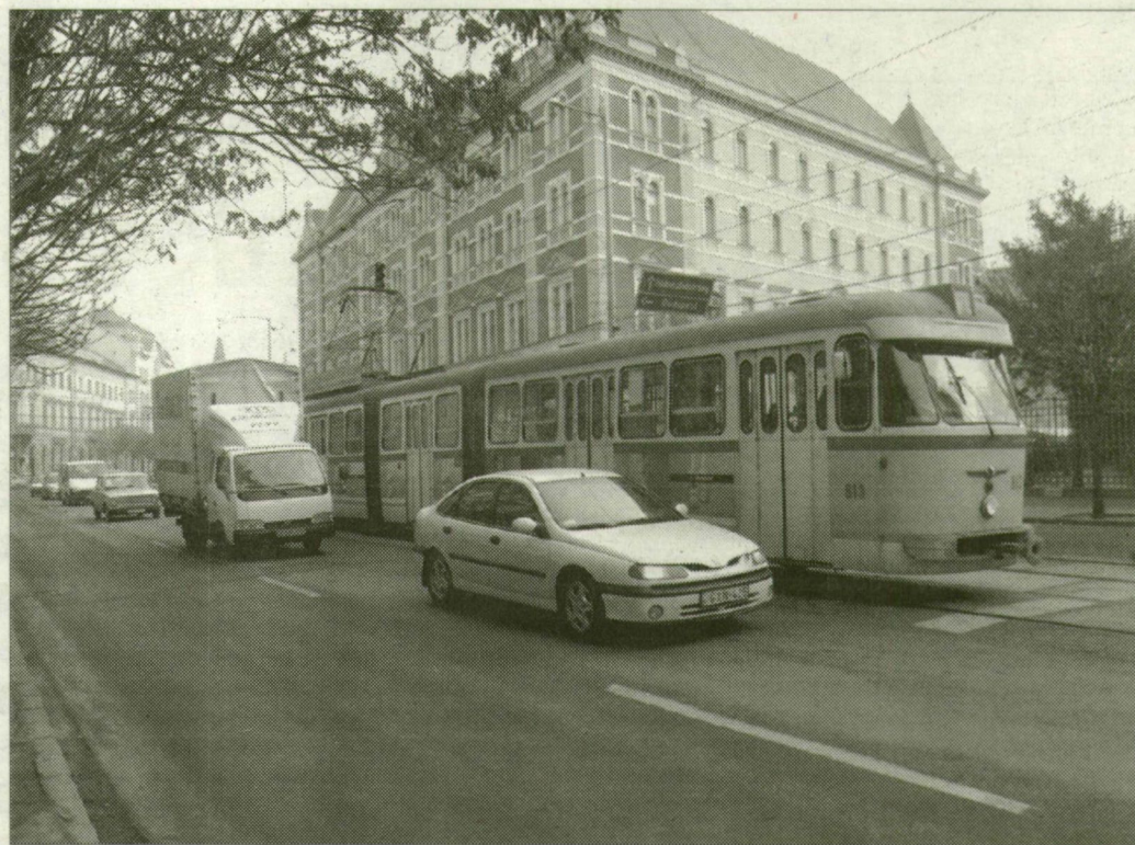
A kiskörút nagyon átalakul: gyorsabb is, zöldebb is lesz az ígéretek szerint

A rehabilitáció után két sávon, süllyesztett pályán, az út közepén fut majd a villamos. Ugyanazokat a sávokat használják majd az autóbuszok is, így a fennmaradó kétszer egy sávban a mostaninál gyorsabban haladhat a forgalom. Az út menti fasort mindkét oldalon megtartják, az Anna-kút felől érkező járművek az is előfordulhat, hogy idén sokan csak a hónap második felére vettek félhavi bérletet, hiszen január első hetében gyakorlatilag nem volt munkanap – tette hozzá. A vezérigazgató szerint csak a jegyleadások összesítése után, jövő hónapban lehet megmondani, valóban kevesebben választották-e a tömegközlekedést a bérletrendszer átalakítása miatt.