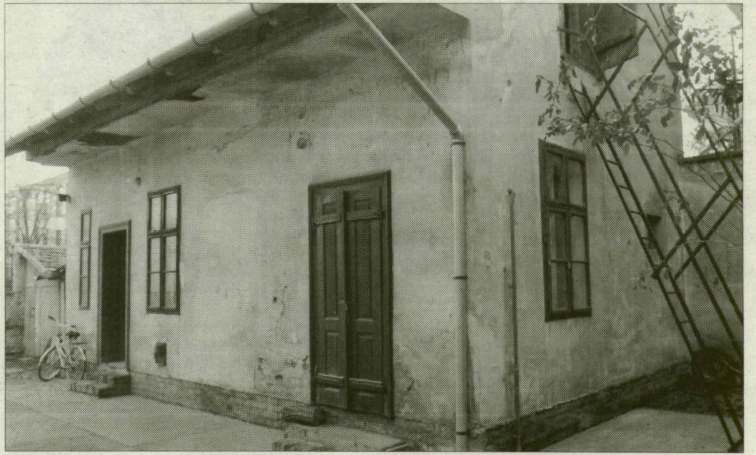
Ebben a házban élt a pár

Csütörtök este egy névtelen telefonáló hívta a rendőrséget, hogy szerinte az udvari lakásban egy halott nő fekszik. A kierkező nyomozók meg is találták a holttestet. Élettársa nyugodtan ült mellette. – Egy kicsit furcsálltam, hogy napok óta egyedül ment a férfi mindenhol. Korábban mindent együtt csináltak a nővel – tudtuk meg az egyik la-