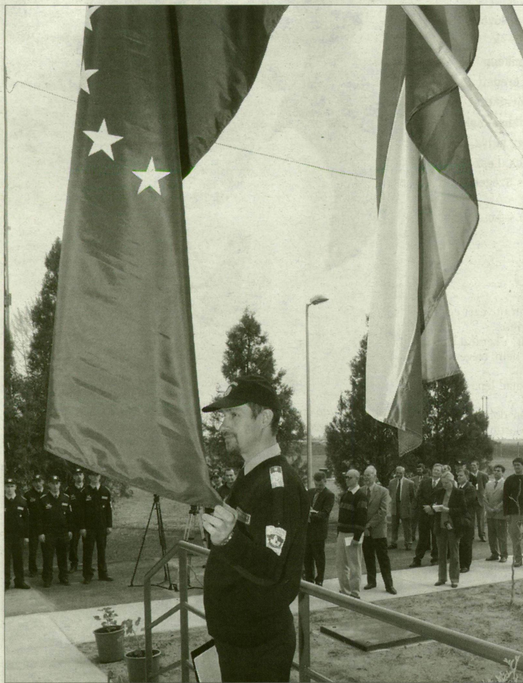
Az ünnepségeken már együtt leng az uniós és a magyar zászló