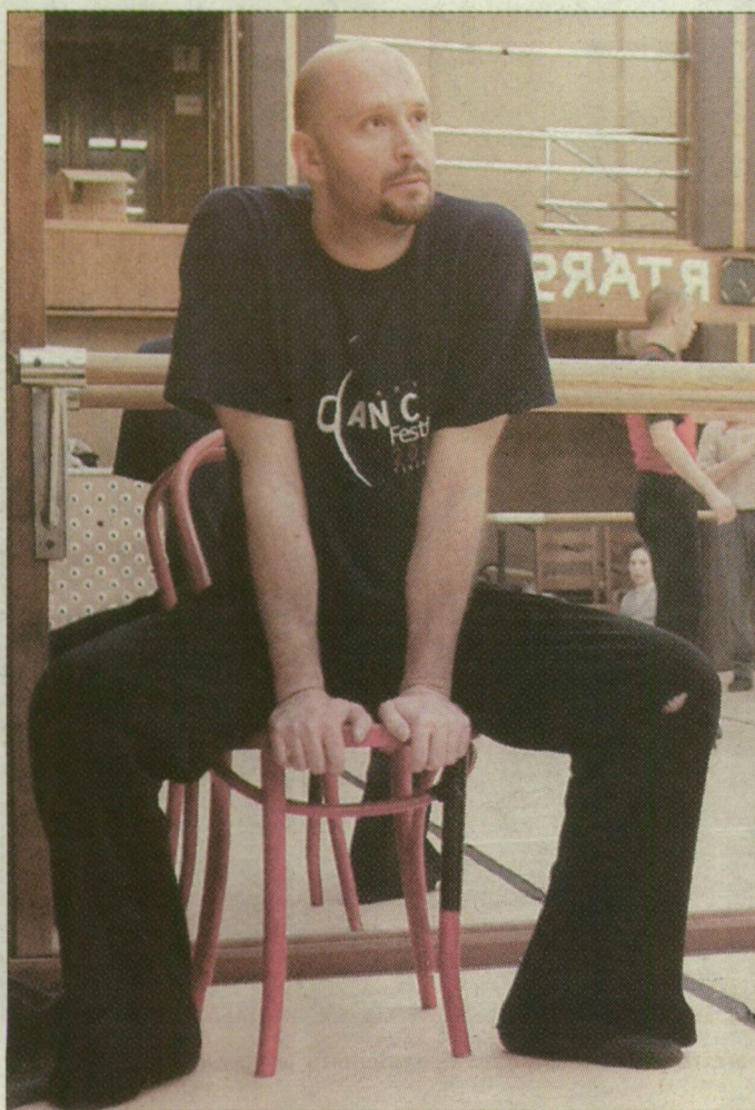
Juronics a próbán

Az argentin koreográfus – amikor a szegedi együttesnél is vendégeskedett, akkor már huzamos