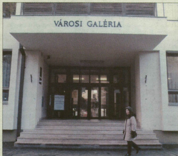
Az egykori városi pártbizottság épületének hasznosítása vihart kavart Csongrádon