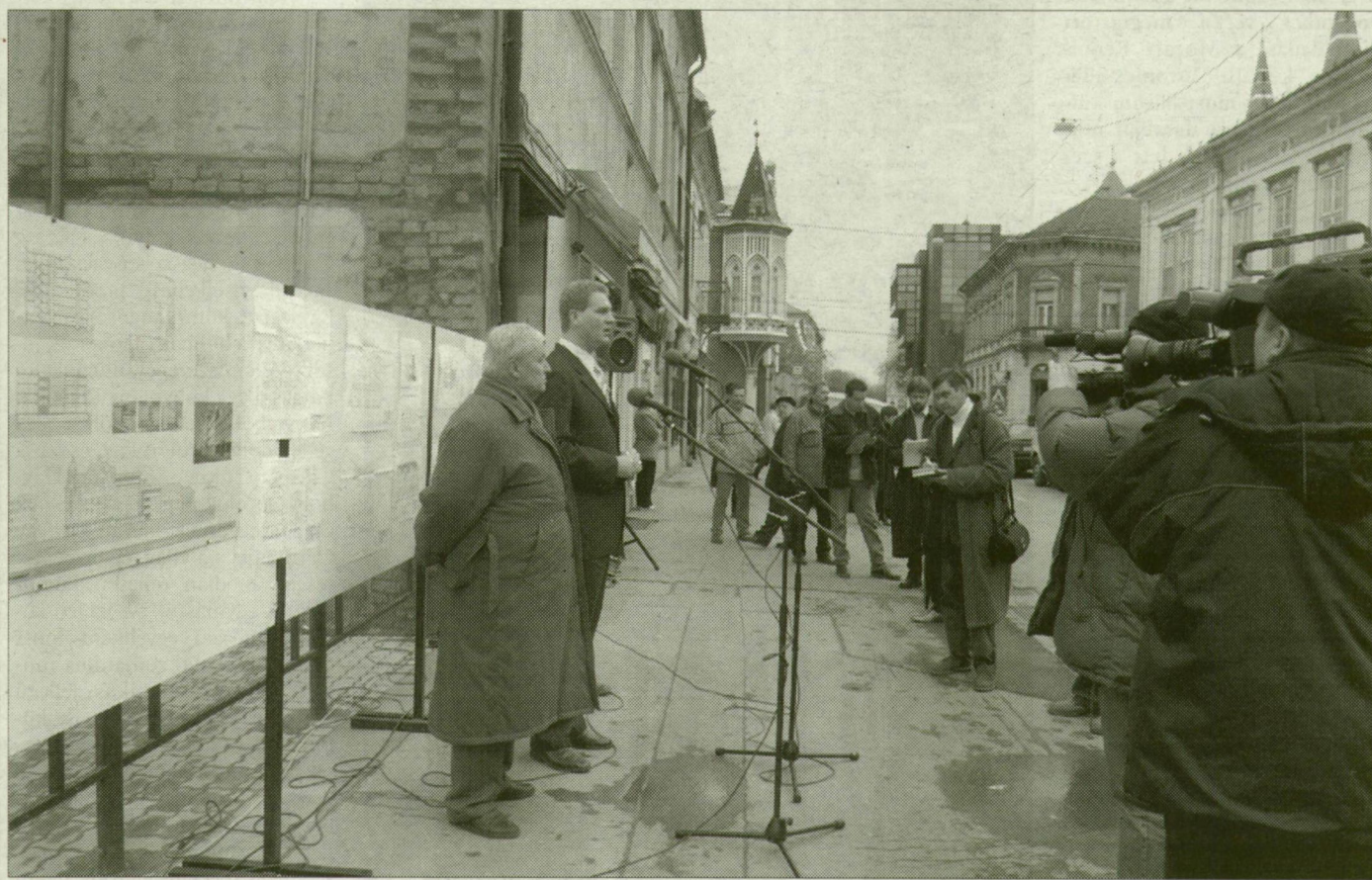
A Somogyi utcai foghíjtelek előtt a polgármester beszélt a rekonstrukcióról