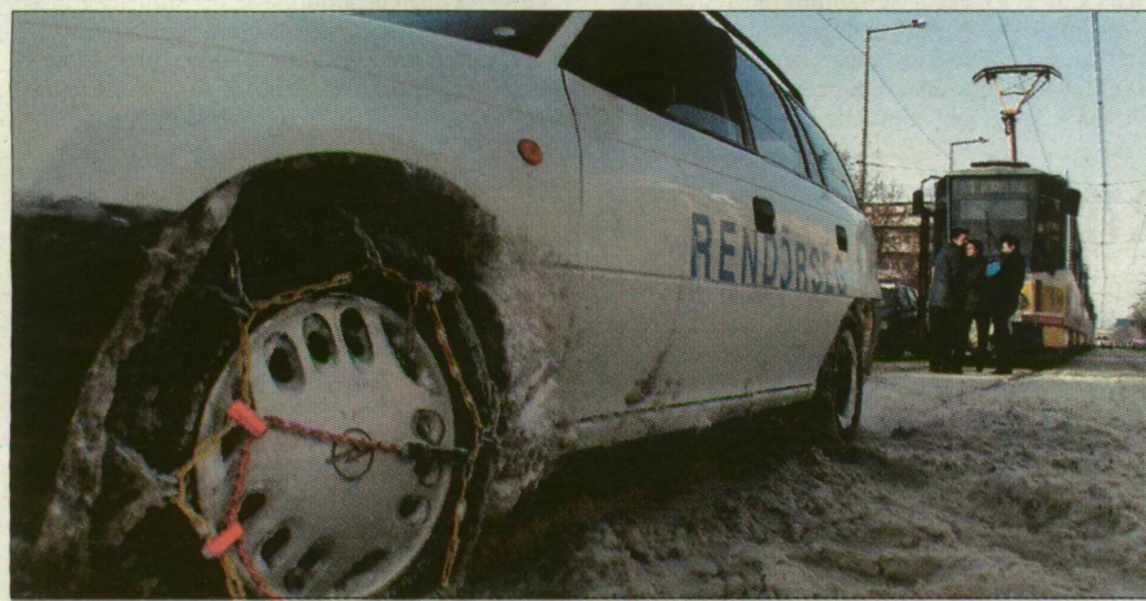
Rendkívüli helyzetben még hólánc is akad a rendőrségen.