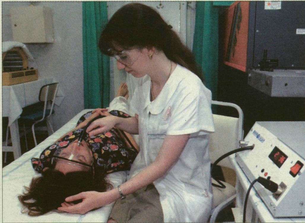
Orvosi eljárásá minősítették az új fényterápiás kezelést.