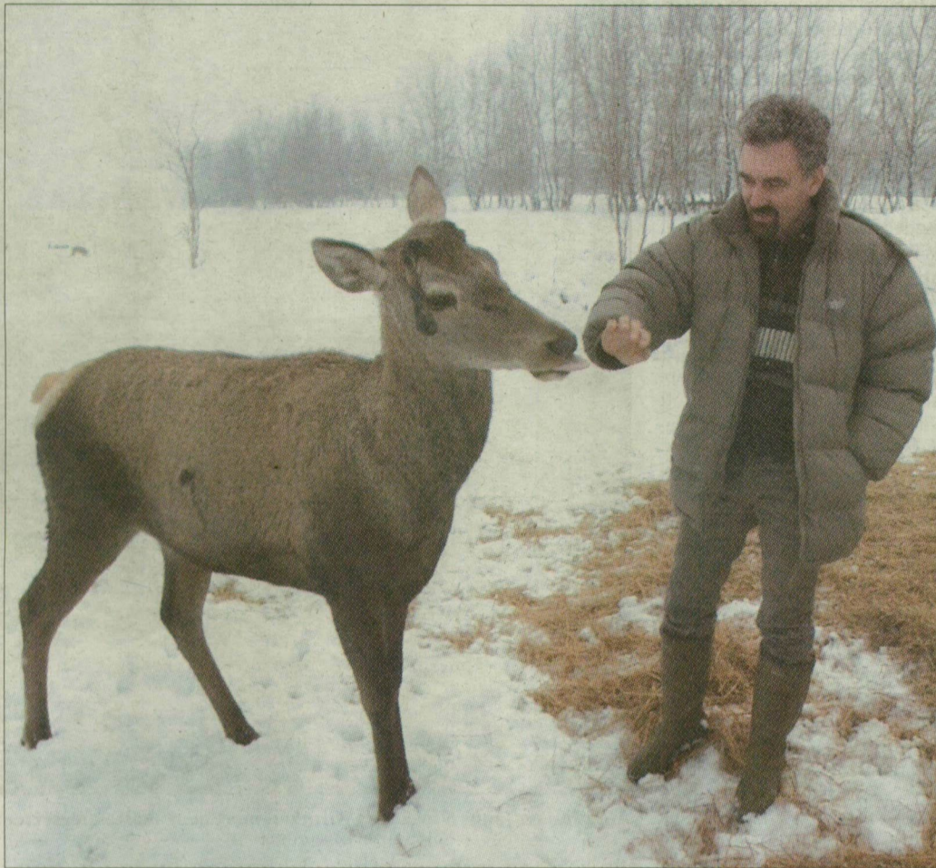
A téli etetés nélkülözhetetlen része a vadgazdálkodásnak.

A több mint 18 ezer hektárnyi terület vadállományáért felelős hódmezővásárhelyi Előre Vadásztársaság egy-egy évben 500-600 mázsa szemestakarmányt (kukorica, búza, napraforgó) és 20-25 nagybála lucernaszenát tartalmazó, s etet fől a vadállománnyal a területén található kilencven etetőben és egyebütt. Az etetők fedettek, így víztől, hótól mentesen nem vesztik tápanyagtartalmából a takarmányt. Ahol a nyomokból ítélve rendszeresen jár a vad, így hamar elfogy a kihelyezett táplálék, szóróetetőt is alkalmaznak. Például százméterenként kiszórnak egy-egy vasvillányi lucernaszenát, vagy a vaddisz-