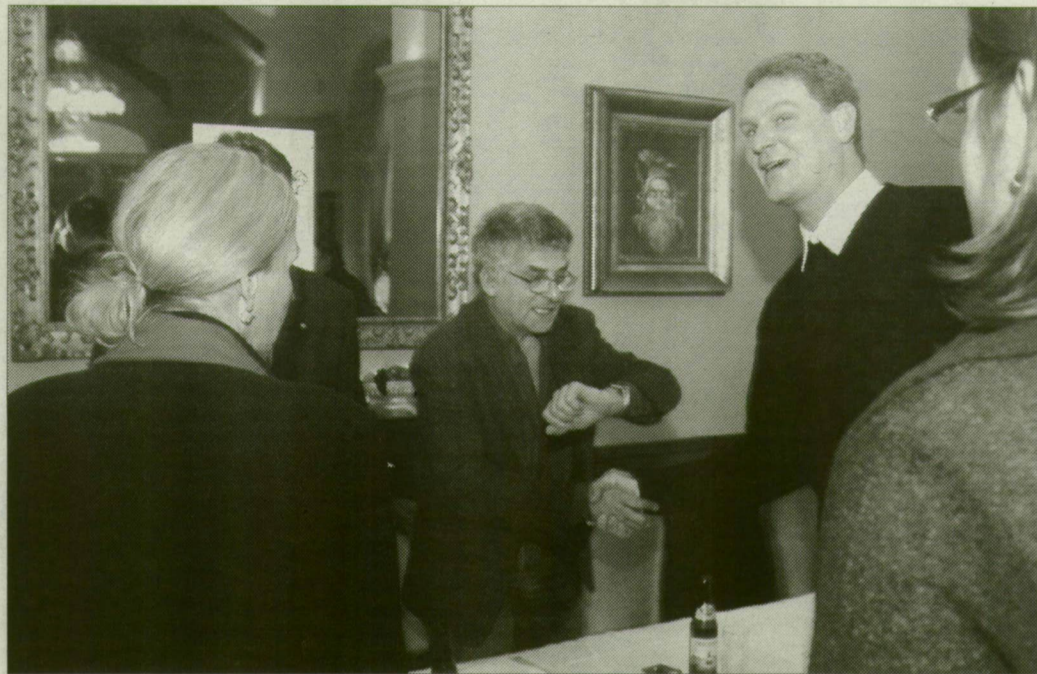
Egyeztetik a programokat a város és a színház vezetői.