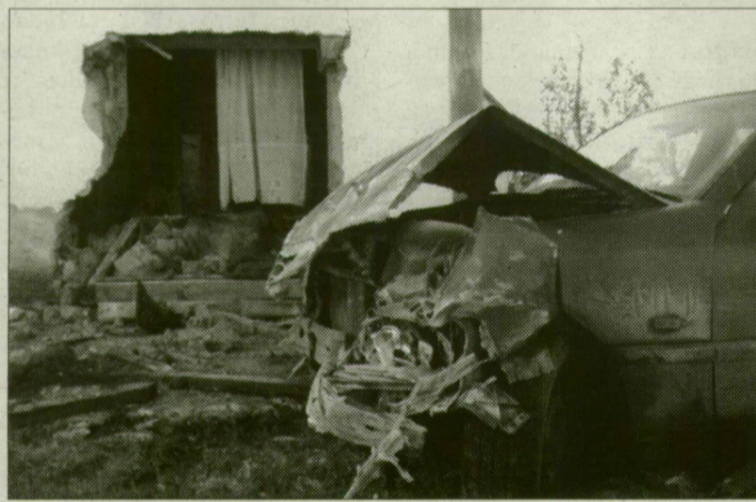
A szobafal bedőlt, a kocsit összetört.