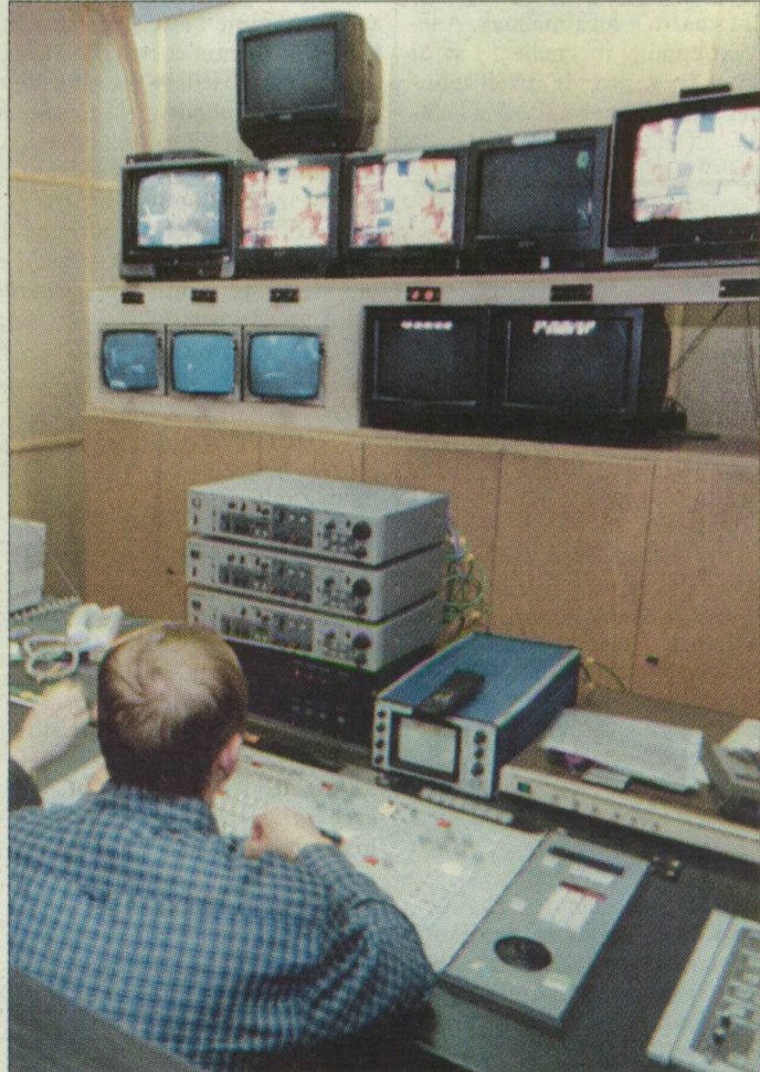
A műsorkészítőknek több millió forinttal tartozik a Szeged TV-t működtető cég. (Képünk illusztráció.)