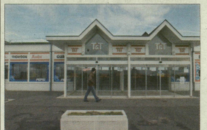
Az átalakítást várhatóan 2004 elején kezdi meg az utazási társaság.