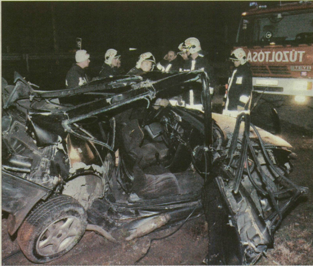
A baleset súlyosságáról a kép önmagáért beszél.