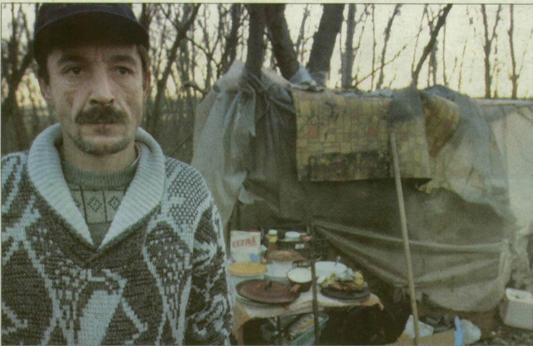
Feri a csavargó támadása óta nem meri magára hagyni társát.

Tavaszi óta élnek így. Az asszony elvesztette lakását (a részletekről nem akart beszélni). Négy- és hatéves gyermekeiket nem hagyhatták hajlék nélkül, ezért belátták: jobb lesz nekik az intézetben, ahonnan utóbb jóvaló nevelésükhöz kerültek a