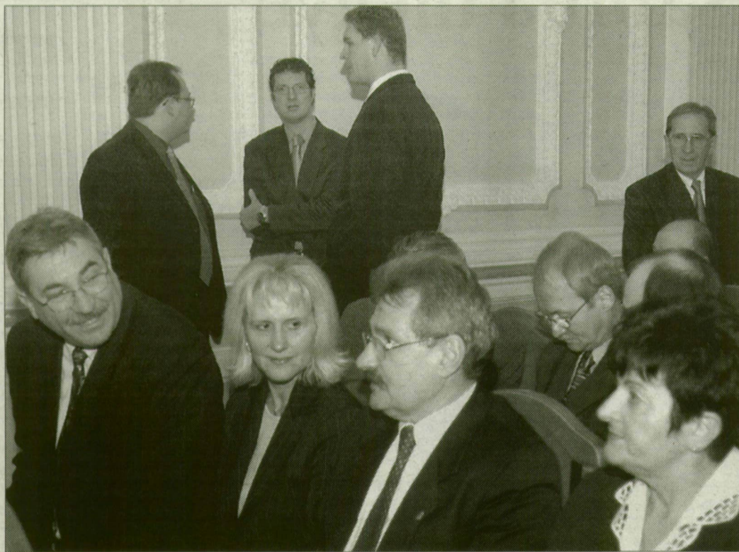
Politikusok és gazdasági vezetők a partnertalálkozón.