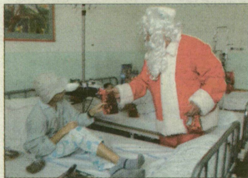
A Mikulást a betegek is várják.

A Mikulás már tegnap útnak indult, hogy ajándékokat vigyen a szegedi apróságoknak. A gyermekklinikára és a gyermekkorház kis betegeti nagy örömmel fogadták a nagyszakállút, aki ma a város több pontján is felbukkan majd. A sérült gyermekek játékos délelőttjére a sportcsarnokba, a nagycsaládokhoz pedig a volt Dugonics moziba látogat el.