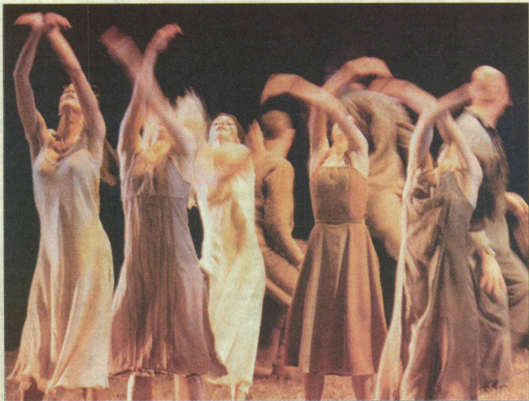
Jelenet a Carmina Buranából.