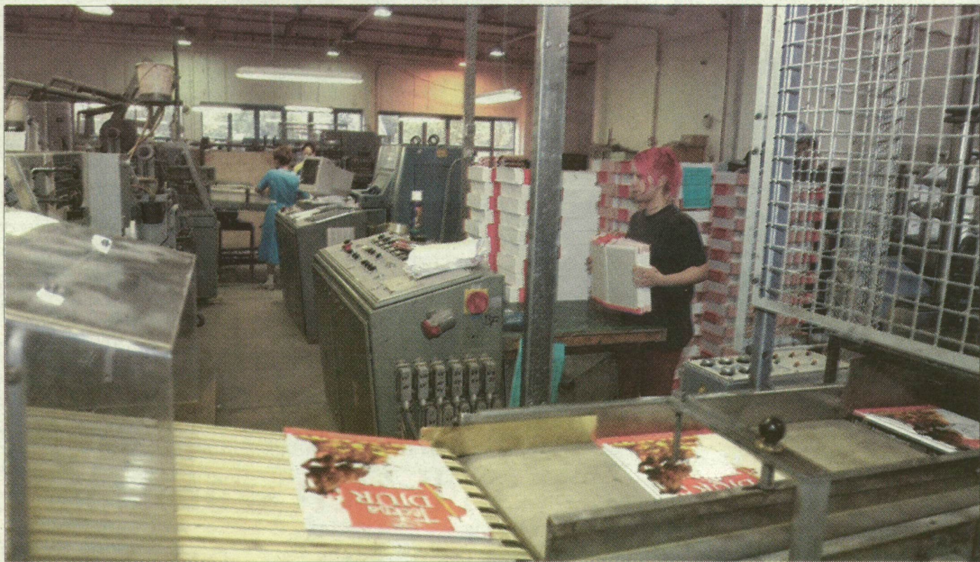
A cég a szakmunkástanulók képzését is felvállalja.