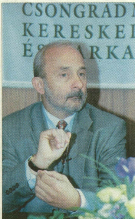
Csillag István miniszteriumában született a döntés.

A szegedi önkormányzat természetesen lobbizott azért, hogy a brüsszeli forrás is