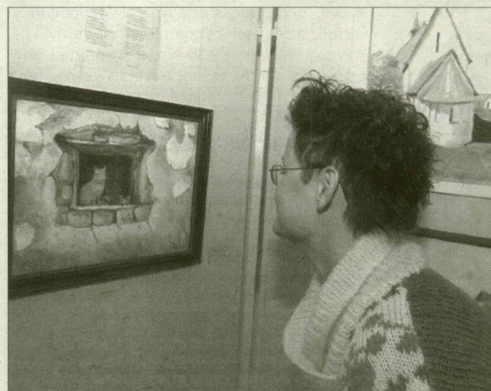
A Németh László Városi Könyvtárban látható kiállítás folyamatosan vonzza az érdeklődőket.