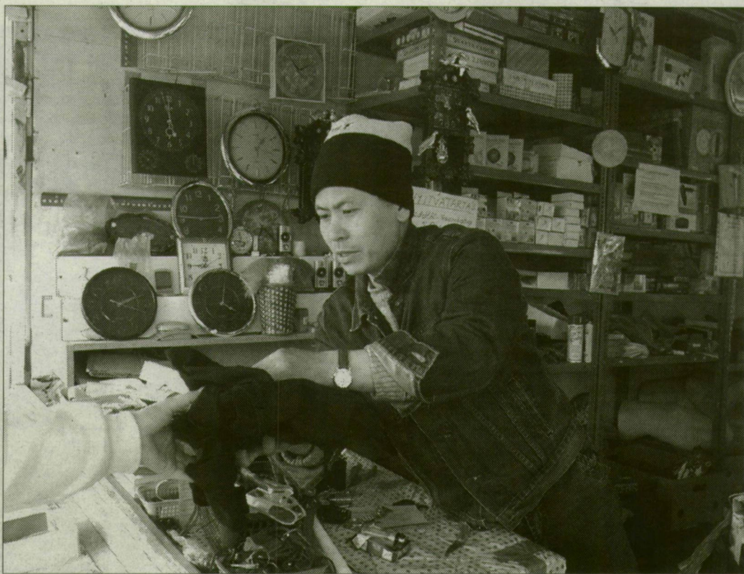
Egy vietnami kereskedő a kínaiak között, a szegedi Cserepes sori piacon.