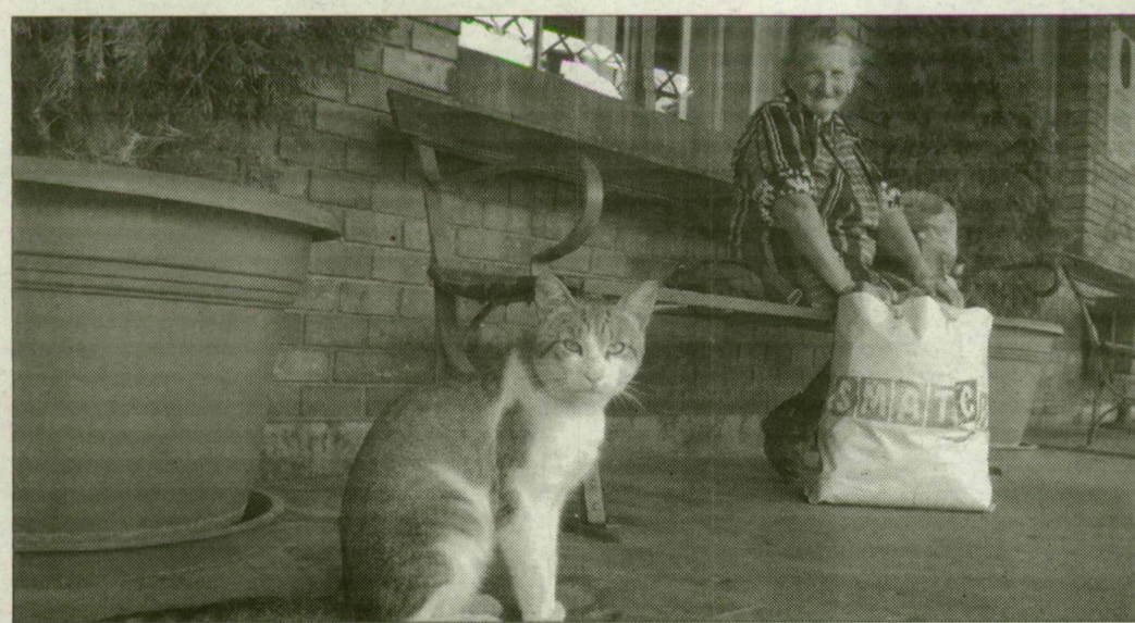
Az illetékesek a várakozók türelmét is kéri.

Megnehezíti a forgalom lebonyolítását, hogy Cegléd és Szeged között a vasúti pálya egyvágányú, ezért az ellentétes irányba tartó vonatoknak az állomáso-