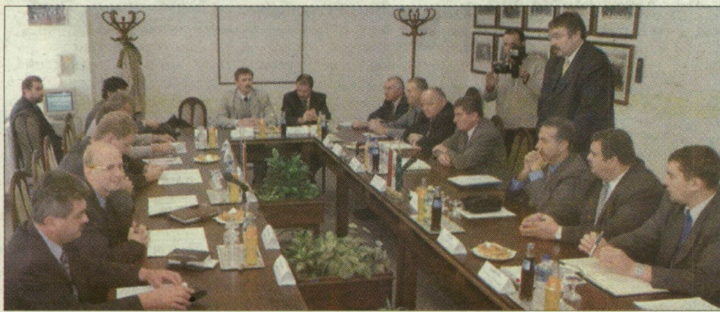
Sok képviselő és rendőr is elfér kis helyen.