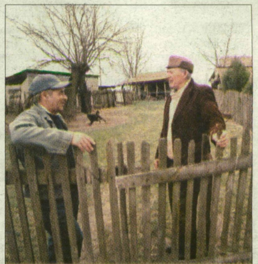
A tanyákon sok idős ember él.

– Hogy miért harcolunk a tanyaiakért? Erre csak annyit mondok: egy háromgyermekes család közelebbi gyermeke szerint tanyán élni a legjobb – folytatta a polgármester, országgyűlési képviselő, aki már hat éve küzd az úgynevezett tanyaprogram parlamenti elfogadtatásáért.