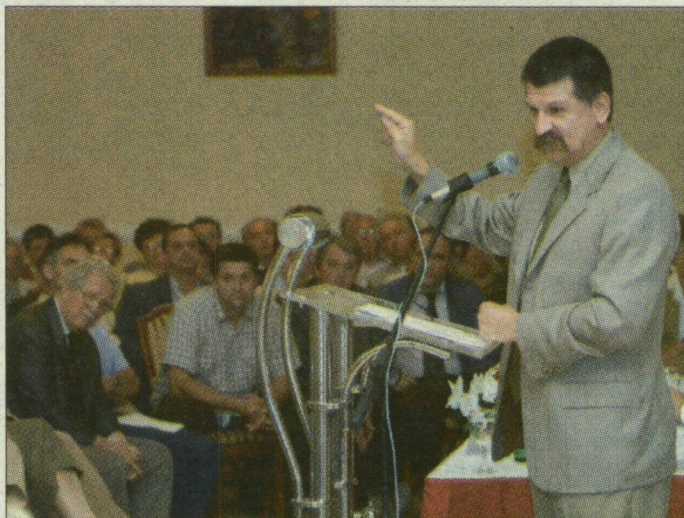
Kövér László: A kormányban nincs elképzelése.

– Az MSZP június óta 700 ezer, az előző év novemberéhez képest