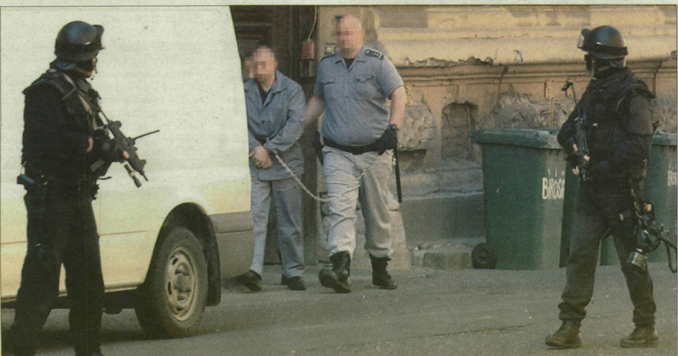
A rendkívül szigorúan őrzött rabot kommandósok felügyelete mellett szállították el a bíróságról.

Példátlan biztonsági intézkedések mellett szállították a megyei bíróság épületébe tegnap egy bilincsbe vert rabruhás férfit. A rendkívül veszélyes rab négy éve, a főváros közelében rabolt ki társával egy pénzszállítót.