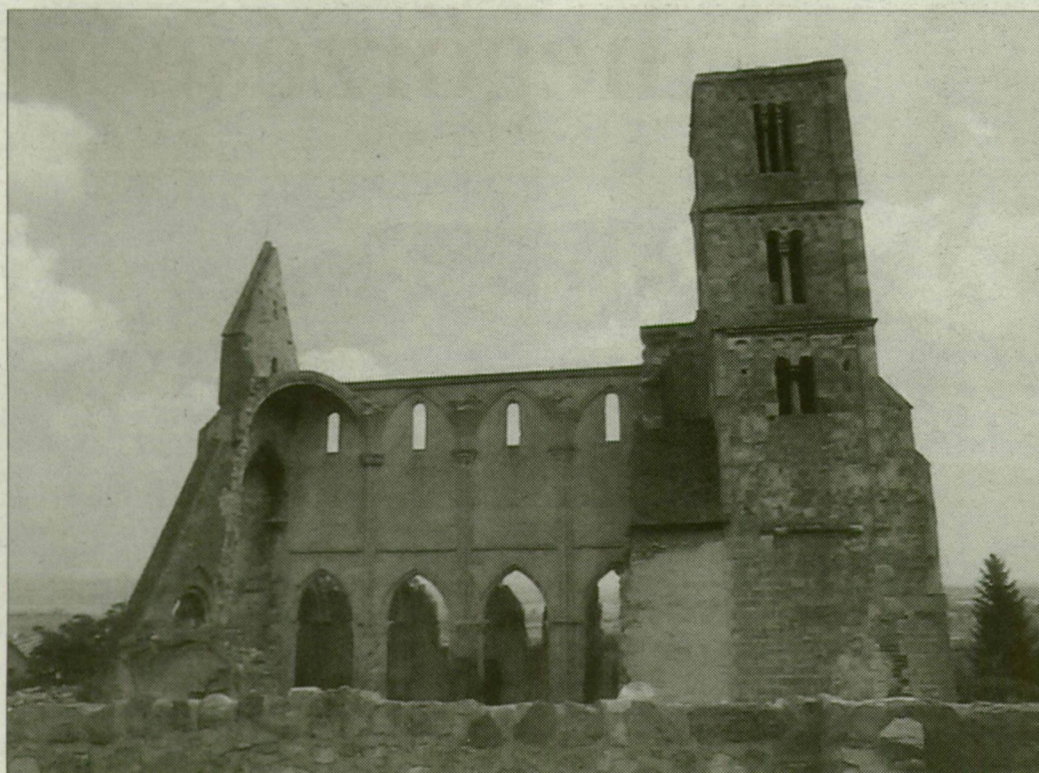
A zsámbéki templomrom ma már csak érdekes látnivaló.

Nehezen találhatók meg a múlt történelmi emlékei Nyergesújfalun. A Duna partján több kilométer hosszan elnyúló, ám igencsak keskeny település legfőbb látnivalója időben az ókorba vinné a szemlélőt, ám az egykori Crumerum nevű, a település nyugati felén álló dombon emelt erődnek ma már nyom sincs. Az 1282-ben Nergedscednek nevezett Nyergessel együtt Újfalut (Uyfalun néven) először az Anjouk ide-