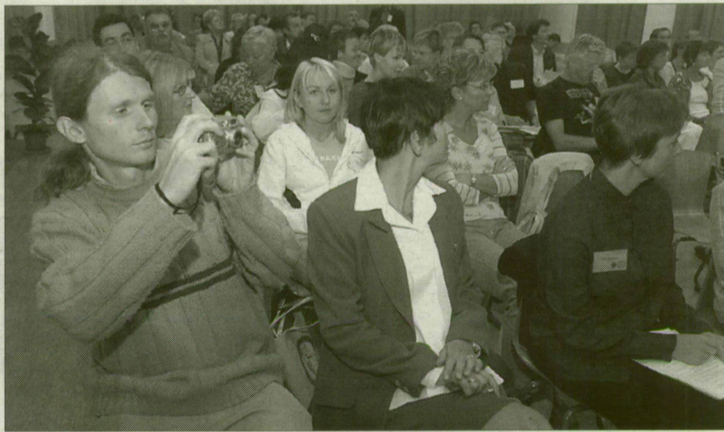
A főiskolán nagy érdeklődés kísérte az előadásokat.

Nemzetközi környezeti nevelési konferencia kezdődött Szegeden és Algyőn. A négynapos rendezvényen a tanárképzésről és környezetvédelemről tartanak előadásokat.